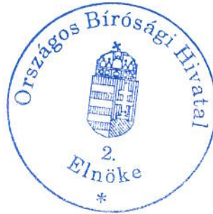
dr. Handó Tünde az Országos Bírósági Hivatal elnöke